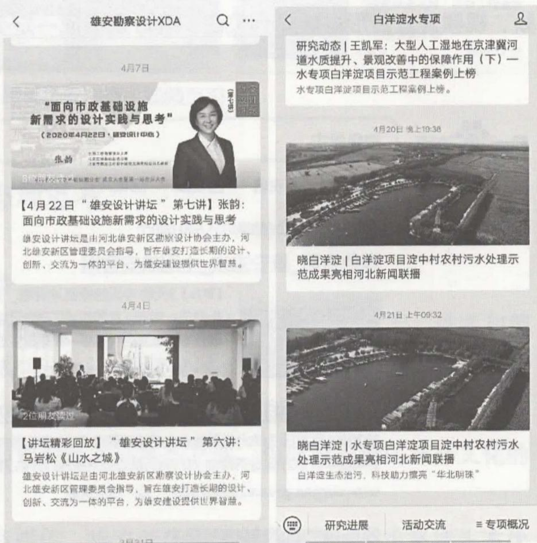
图11-3-4 雄安勘察设计XDA（左）、白洋淀水专项（右）公众号页面