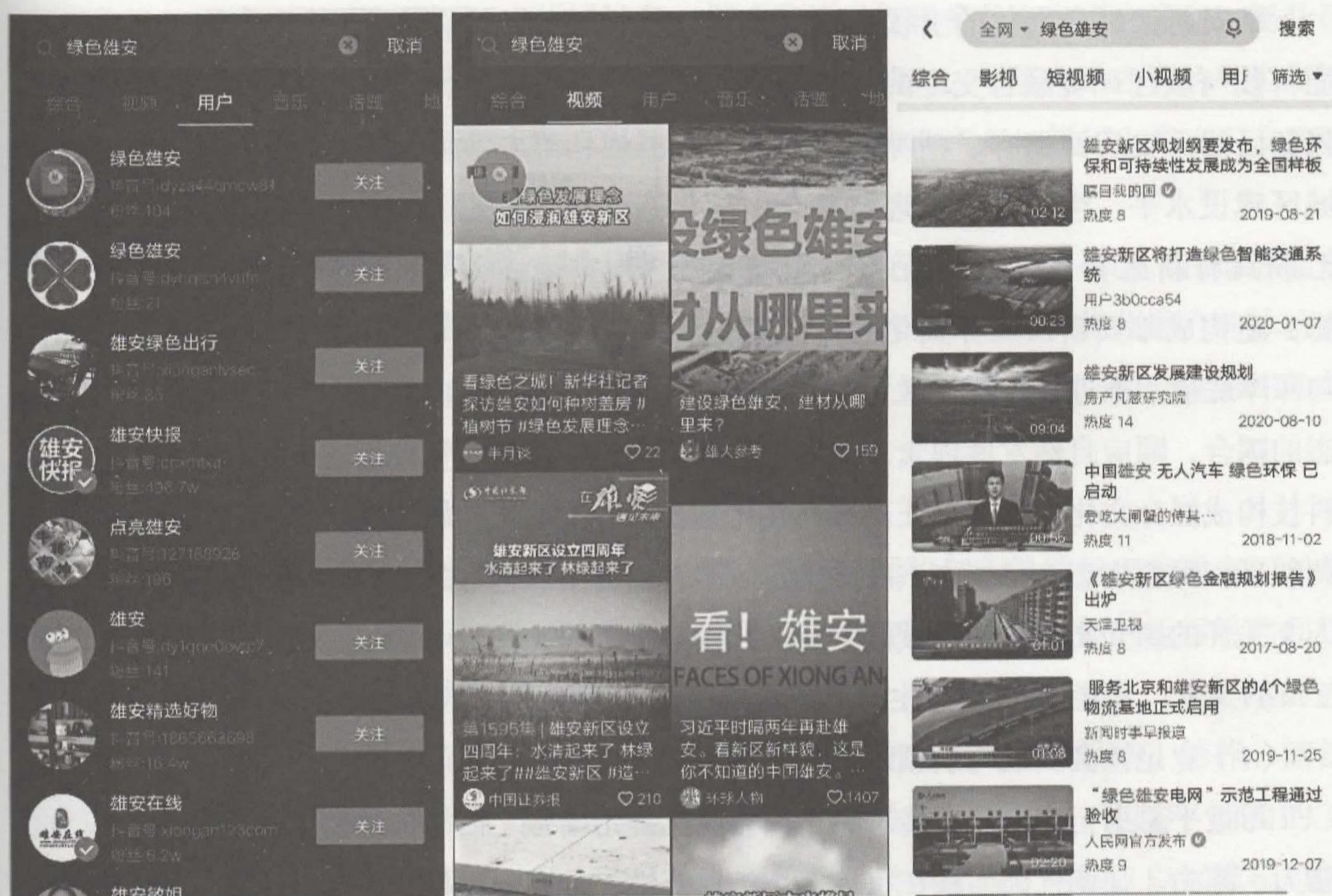
图11-3-7 绿色雄安主题小视频页面