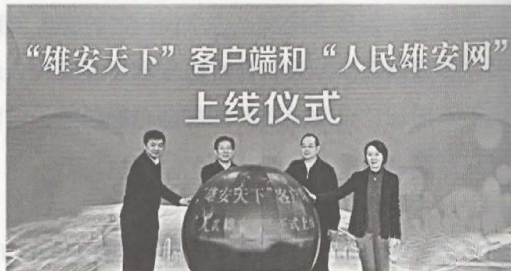
图11-3-2 雄安媒体平台搭建

除了官方媒体之外,雄安新区成长起一批以雄安绿色发展为主题的专业媒体,以新媒体形式为主,创办主体以专