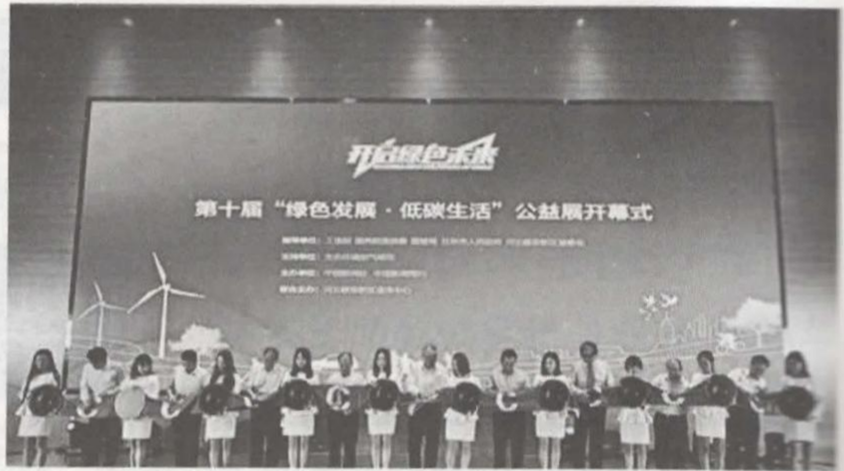
图11-3-5 2020年“绿色发展·低碳生活”公益展

媒体宣传引导对绿色雄安城市形象塑造、传播发挥了不可替代的重要作用。绿色雄安的媒体宣传呈现主体多元化、内容层次化、形式多样化的特点。宣传主体包括国家与政党的宣传部门、专业或行业机构、自媒体等。截至2021年8月,百度可搜索的“绿色雄安”主题的信息为3160万条(图11-3-6),信息来源包含中国雄安官网、央广网、新华网、人民网等官方权威网站,也包括绿色中国网、中证网等专题类网站,同时,也存在一批微博、公众号自媒体;不同宣传主体针对不同受众对绿色雄安进行不同角度的解读分析及信息输出,从而为不同的受众提供层次化、定制化、专业化信息输出;形式多样化主要体现在“绿色雄安”主题相关的文字、图片、音频、视频等宣传形式均受到关注,且分别形成一定受众群体(图11-3-7)。