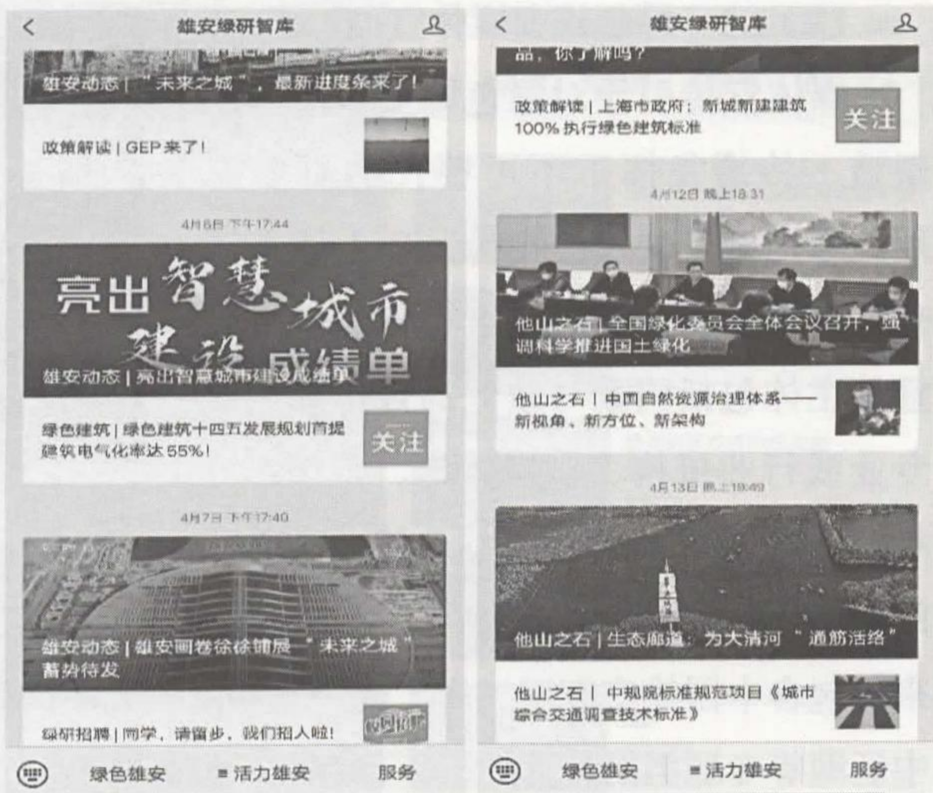
图11-3-3 雄安绿研智库公众号页面

活动展览类。以直观的论坛、展览等形式，为公众呈现雄安新区绿色发展现状及前景，宣传绿色发展理念。2019年6月，由中国新闻社、中国新闻周刊主办的“绿色发展·低碳生活”公益展在雄安新区举办，公益展在雄安新区市民服务中心向公众开放，为期两周，全景呈现中国绿色发展进程，给公众带来了一场兼具知识性、互动性和趣味性的影像展（图11-3-5）。