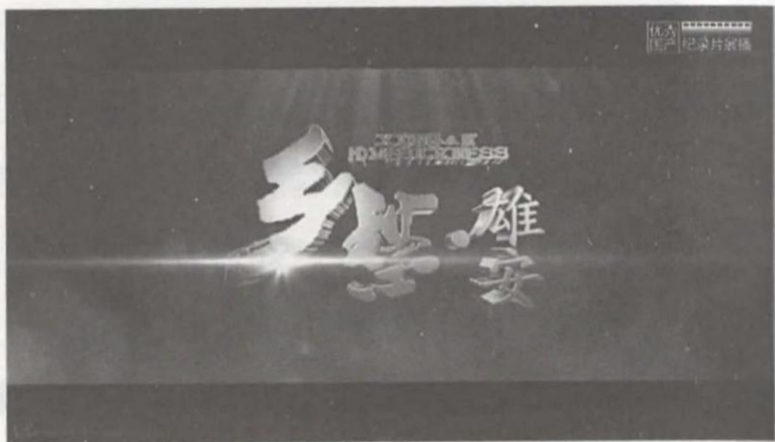
图11-3-1 《乡愁·雄安》纪录片

要源动力。” ① 雄安位于京津冀津冀的交汇点,是燕赵文化、京味文化、津门文化三地文化相接相通之处。生态资源上,有着被称为“华北之肾”的白洋淀,抗日时期以活跃在白洋淀的雁翎队为代表的红色文化资源,及依托于白洋淀以孙犁为代表的荷花淀派。历史资源上,有宋辽古战道、雄县古城墙、黑龙江燕长城为代表的东周