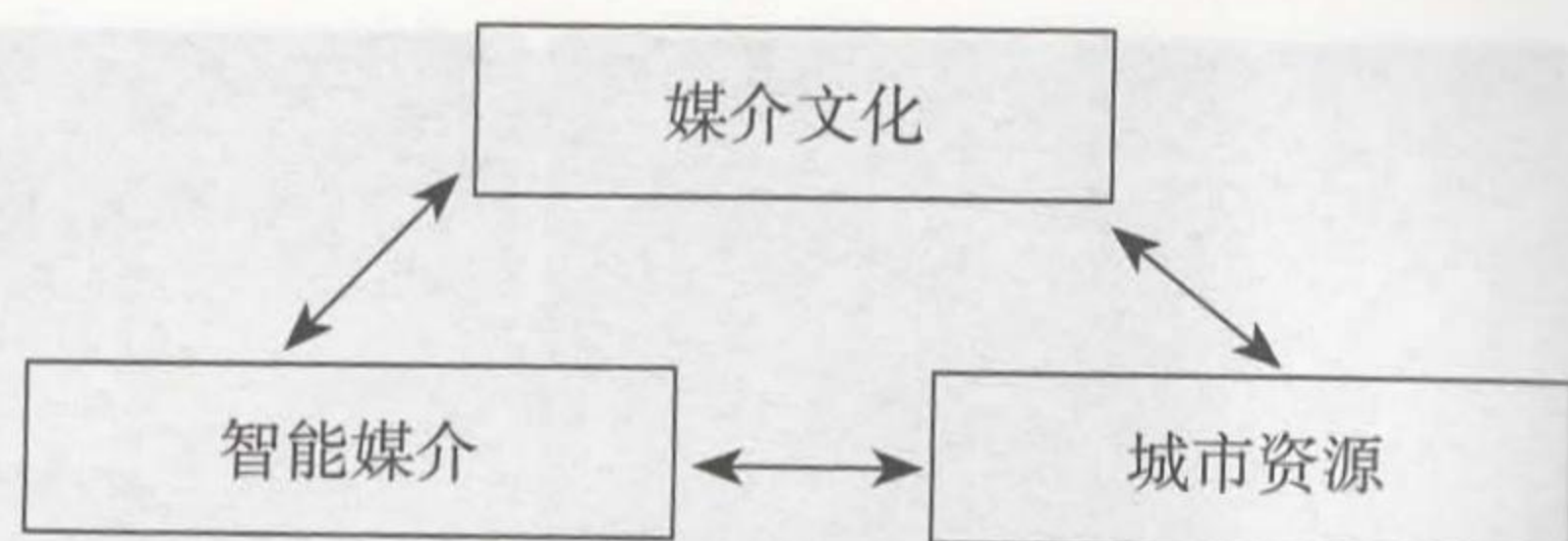
图11-3-8 “媒介文化-智能媒介-城市资源”关系框架

雄安新区媒介文化的引领需要激发智能科技与城区环境融合交汇的积极想象,将新区的历史资源遗存、精神文明积淀与城区建设水平、生态环境梳理与整合,融汇成具有新区特色的话语元素与叙事素材,建构成雄安新区媒介文化的资源储备